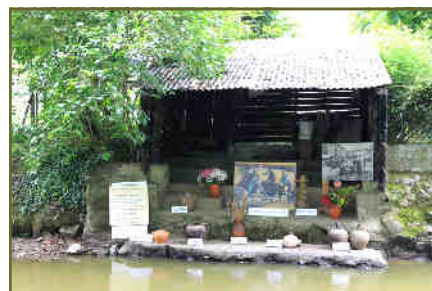
-Pierre COISMAN pour l'Hôtel d'Potiers