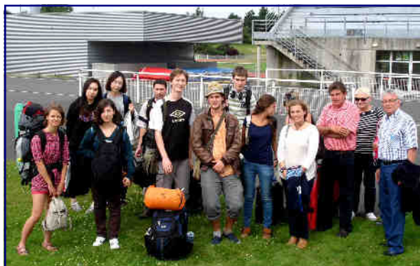
Le groupe à son arrivée au stade du Penthièvre