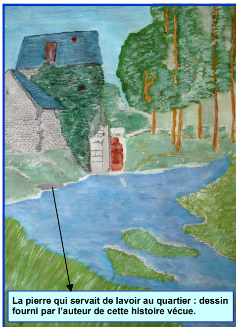
La pierre qui servait de lavoire au quartier : dessin fourni par l'auteur de cette histoire vécue.

Les quatre familles qui utilisaient ce lavoire se donnaient un tour de rôle, il était situé près du gué, là où les enfants se baignaient aussitôt que la température le permettait, sans savoir nager, ils marchaient la tête hors de l'eau, explorant la rivière, avec confiance car l'eau claire leur permettait de contrôler leurs pas. Merveilleux terrain de jeux avec les poissons qui filaient entre les doigts.