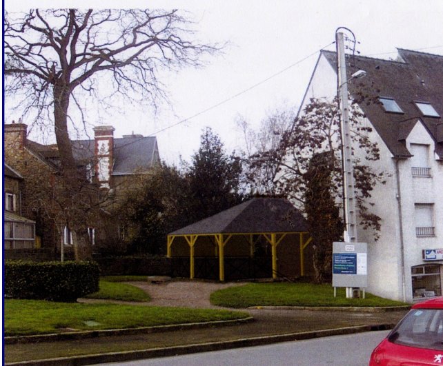
DOCUMENT GRAPHIQUE SITUANT LE PROJET DANS LE PAYSAGE D'APRES LA VUE B

Comme son historique l'indique (cf documentation ci-dessus), ce lavoir a été, dans les années 50, recouvert d'une dalle de béton qui, à ce jour, le fait confondre avec une vespasienne.