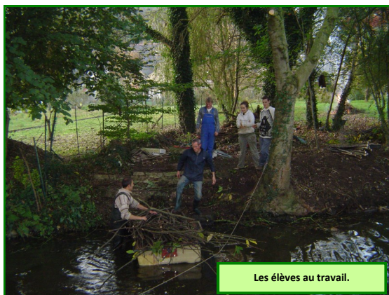
Les élèves au travail.