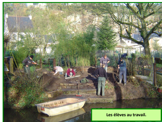
Les élèves au travail.