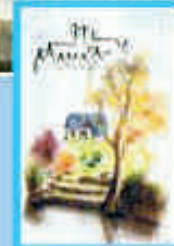
Association Les Lavoires Lamballais